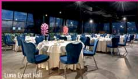
Luna Event Hall