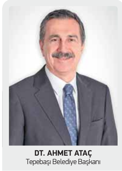
DT. AHMET ATAÇ Tepebaşı Belediye Başkanı

Metin Özöğüt Yaşam Merkezi, duyarlı vatandaşların desteklerini Eskişehir’e kazanım olarak sunmaya devam ediyor. Özöğüt ailesi tarafından inşaat giderleri karşılanan