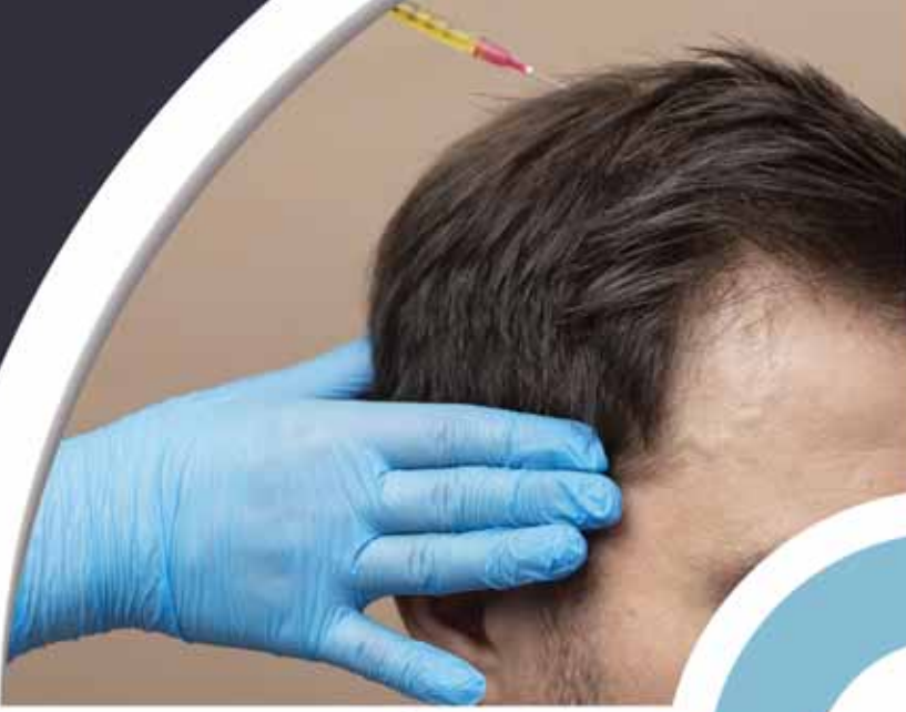
Fue Yöntemi İle Saç Ekimi