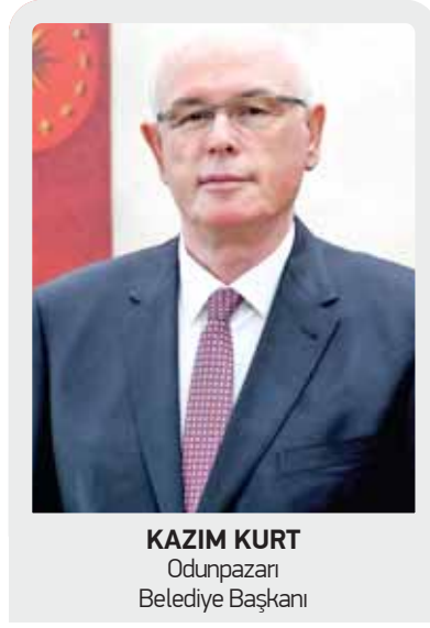
KAZIM KURT Odunpazarı Belediye Başkanı

ODUNPAZARI Belediyesi olarak, turizmin her alanına yönelik çalışmalarımız bulunmaktadır. Sağlık turizmi de bu çalışmalarımızın bir parçasını oluşturuyor. Şehrimizin sağlık turizmi potansiyelini değerlendirerek, bu alanla ilgili hizmetlerin geliştirilmesine yönelik çeşitli çalışmalar gerçekleştiriyoruz. Yerel yönetimlerin sağlık turizmine katkısının önemli olduğunu düşünüyorum. Sadece sağlık hizmetlerinin kalitesiyle değil, aynı zamanda turistlerin şehirdeki konaklama, ulaşım, eğlence ve kültürel faaliyetlere erişiminde de yerel yönetimlerin rolü büyüktür. Bu nedenle, yerel yönetimlerin sağlık turizmini desteklemesi, sağlık tesislerinin altyapısını güçlendirmesi ve şehirdeki diğer turizm unsurlarını geliştirmesi gerekmektedir. Bunun için de Sağlık Müdürlüğünün, Turizm Müdürlüğünün, üniversitelerin en başta da devletin temsilcisi Valiliğin yerel yönetimlere katkı sunması gerekiyor.