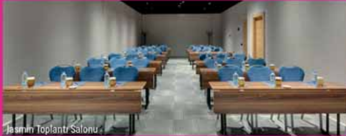
Jasmin Toplantı Salonu