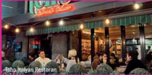
Teho İtalyan Restoran