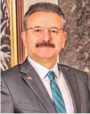
HÜSEYİN AKSOY Eskişehir Valisi

kendi ülkelerindeki sağlık imkanlarını ve giderlerini değil; başka ülkelerdeki tedavi ve giderlerini araştırıp karşılaştırarak hareket etmektedir. Bu kapsamda, dünya genelinde 630 milyon kişinin sağlık turizmi amaçlı sınır ötesi hareketlilikte bulunduğu tahmin edilmektedir.