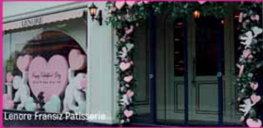
Lenore Fransız Patisserie

Jasmin Toplantı Salonu • Luna Etkinlik Salonu Sao Spa • Pivot Pub • Lenore Patisserie Honjok Türkiye • Teho Restaurant