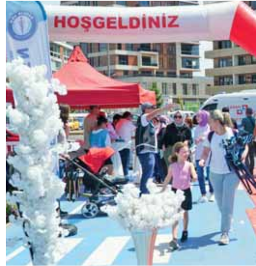
SAĞLIK ÇALIŞANLARI SAĞLIK-SEN ESKİŞEHİR ŞUBESİ İLKİ DÜZENLENEN SAĞLIK FEST ORGANİZASYONUNDA

sağlık merkezleri ile şehre daha fazla turist çekilebilir. Termal turizmin geliştirilmesi, hem yerli hem de yabancı turistler için cazip bir alan oluşturacaktır.